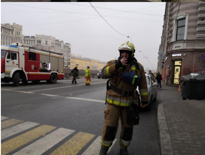
ОНДПР Центрального района 25.12.2019