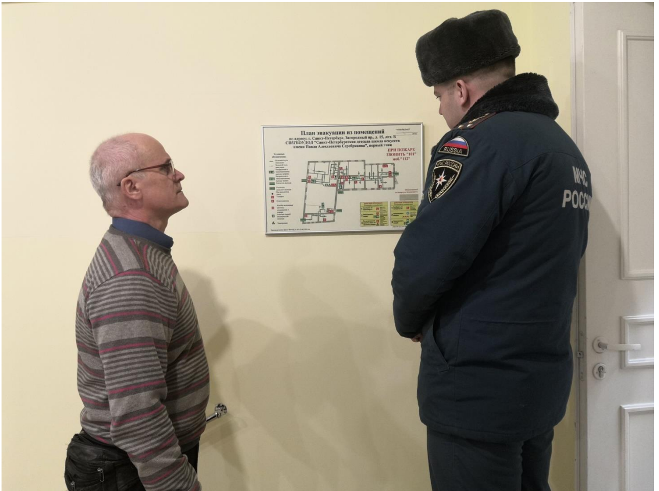
ОНДПР Центрального района 20.03.2020