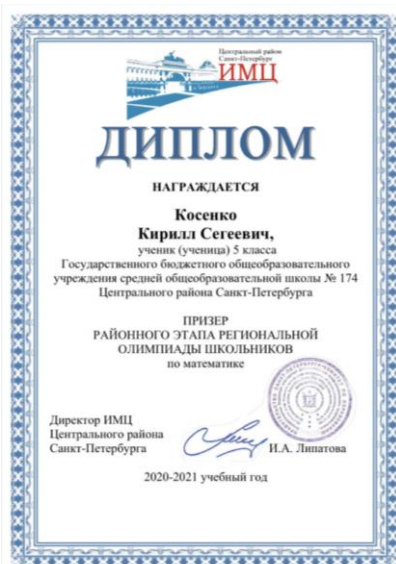
Косенко Кирилл, 5 класс ПРИЗЕР РЭ ВОШ по МАТЕМАТИКЕ