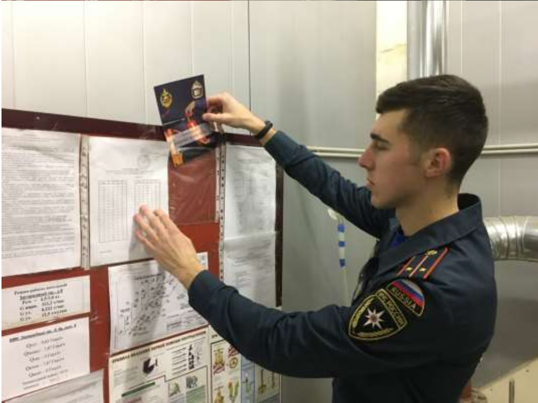
ОНДПР Центрального района 22.11.2019