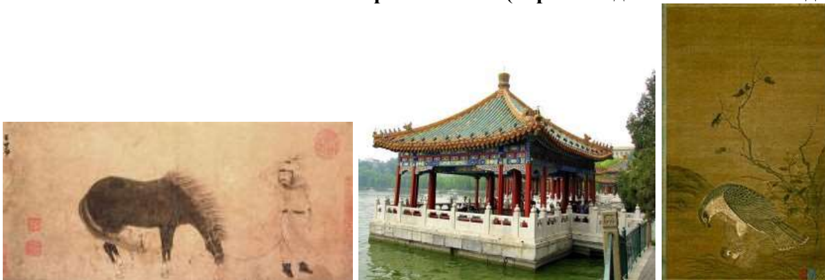
Чжао Мэнфу, «Человек с лошадью на ветру»