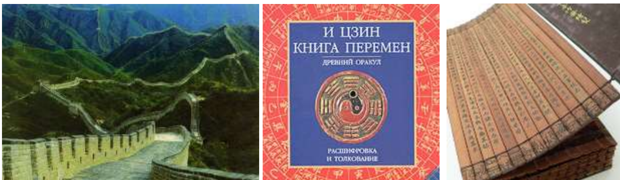
Великая Китайская стена